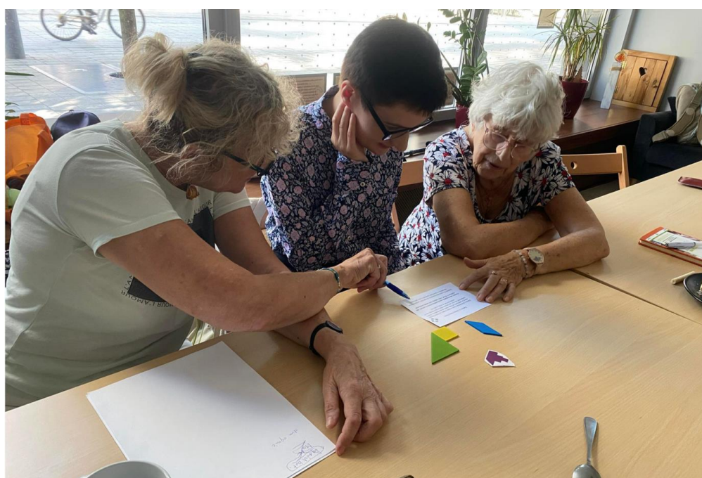
zrobione w trakcie pilotażu gry.

W tej części warsztatu uczestnicy zapoznają się z grą, która stanowi jedno z narzędzi wykorzystywanych do integracji pokoleń w projekcie. Gra opiera się na układaniu elementów tangramu w całość, co pozwala uczestnikom na wspólne rozwiązywanie zagadek, rozwijanie współpracy i budowanie więzi. Podczas gry seniorzy i młodzież pracują razem, co wspomaga integrację oraz rozwija umiejętności współpracy międzypokoleniowej.